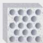
Bloque de silicocalcáreo hormigón ligero hueco