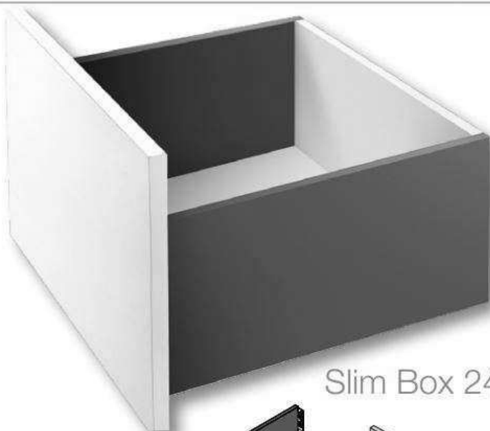
Slim Box 249