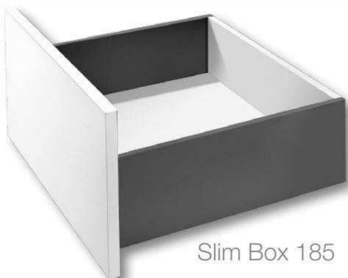
Slim Box 185