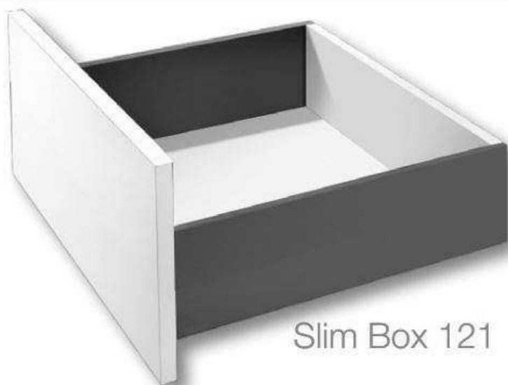
Slim Box 121